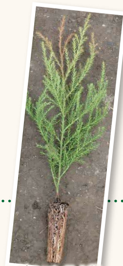
スギのコンテナ苗